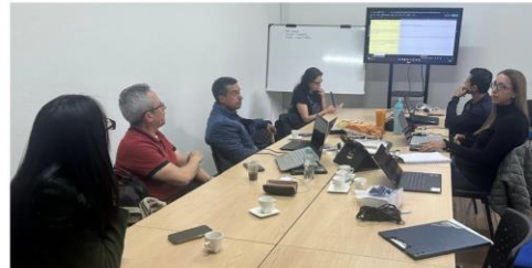
III Sesión - Jueves 8 de Mayo