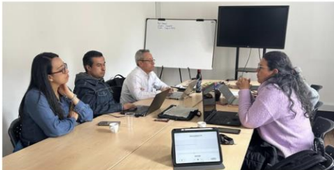
I Sesión - Jueves 24 de abril